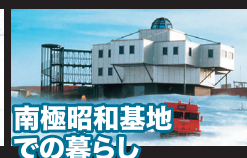
南極昭和基地 での暮らし