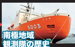
南極地域 観測隊の歴史