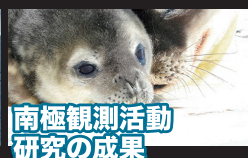
南極観測活動 研究の成果